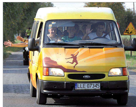
Grupa BUSIMY ma już za sobą pierwsze wyprawy i gorąco poleca taką formę zwiedzania.

Przyjaciele i ich bus przemierzali 8350 km, docierając aż do Barcelony, po drodze zwiedzając dziewięć państw. Podróżowali 24 dni, jedząc co kolwiek i śpiąc, gdzie padnie: w lesie, w polu, na poboczu. Ale jak wspominały, były to jedne z najpiękniejszych dni, jakie przeżyły.