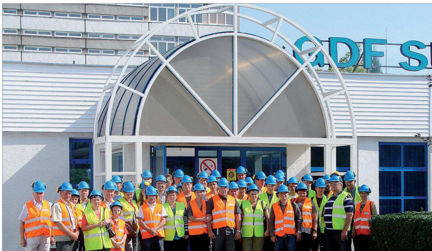
Uczestnicy wyjazdu do Elektrowni Połaniec

Europejski Fundusz Rolny na rzecz Rozwoju Obszarów Wiejskich: Europa inwestująca w obszary wiejskie. Projekt współfinansowany ze środków Unii Europejskiej w ramach Programu Rozwoju Obszarów Wiejskich na lata 2007 - 2013