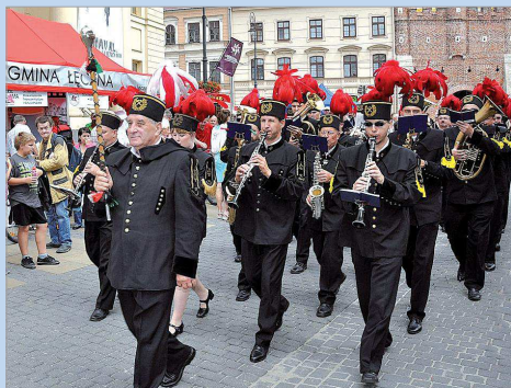
Byliśmy o krok od tytułu „Perła Lubelszczyzny”

27 września w siedzibie TVP Lublin ogłoszono końco-