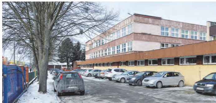
Efektom remontu będzie nie tylko poprawa estetyki budynku, ale przede wszystkim znaczne zmniejszenie jego energochłonności

Poza powyższym projektem w przyszłości prace obejmą także wnętrze basenu – instalacje służące oczyszczaniu wody i – być może – montaż dodatkowych atrakcji. Są pomysły na pozyskanie dodatkowych środków na to zadanie, by w miarę możliwości finansowych budżetu zrealizować to jak najszybciej