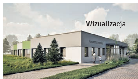
Tak będzie wyglądać budynek przedszkola