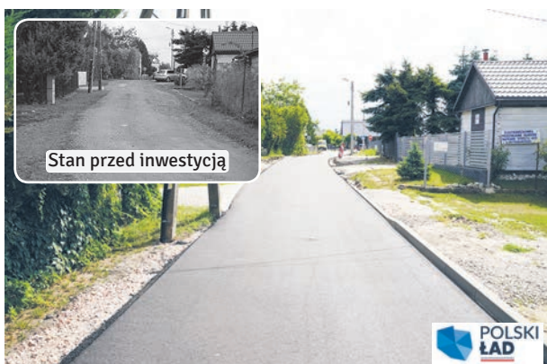
Zakończyły się prace na ul. SPORTOWEJ w Łęcznej. Szutrowa nawierzchnia ulicy została zastąpiona asfaltem. Wzdłuż drogi zostanie wybudowane oświetlenie uliczne.