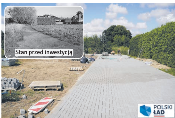
Zakończyły się prace na ulicy SZKOLNEJ w Łęcznej.