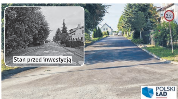
Zakończono kolejne drogowe prace remontowe. Z nowego asfaltu mogą cieszyć się mieszkańcy ul. KSIĘŻYCOWEJ w Łęcznej.