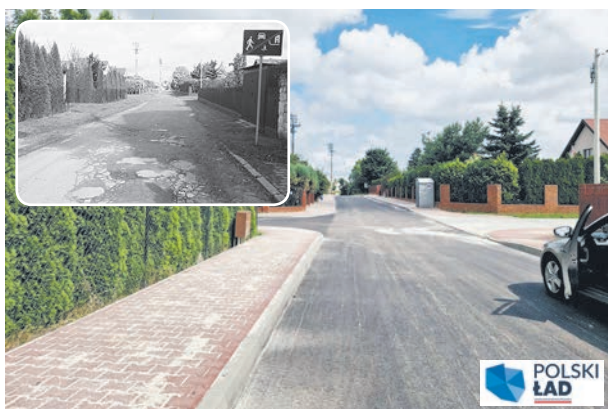
Dobiegł końca remont ulicy SŁONECZNEJ w Łęcznej. Zyskała ona nową nawierzchnię asfaltową. Inwestycja przyczyniła się do poprawy bezpieczeństwa i komfortu użytkownika.