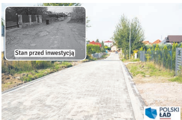
Wyremontowano ul. FIOŁKOWĄ . W drodze została wybudowana kanalizacja deszczowa oraz nowa nawierzchnia z kostki betonowej. Wzdłuż ulicy wybudowano oświetlenie.

Mijający rok obfitował w ważne remonty dróg w Łęcznej. Efekty sfinalizowanych prac podnoszą estetykę miasta i usprawniają ruch drogowy oraz poprawiają bezpieczeństwo. W wielu przypadkach samorząd pozyskał wysokie dofinansowanie zewnętrzne.