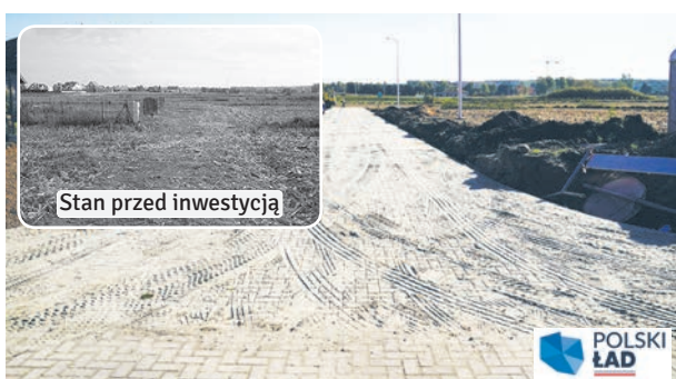
Zakończono modernizację ul. WESOŁEJ w Łęcznej. Dotychczasowa droga polno-szutrowa, zyskała nową asfaltową nawierzchnię oraz oświetlenie uliczne.