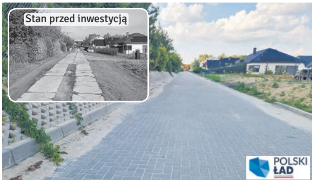
Część ul. OGRODOWEJ zyskała nowy asfalt, a na części ułożono kostkę brukową. To dojazdu do posesji oraz do ROD RELAKS Łęczna. Działkowcy zyskali zmodernizowany parking.