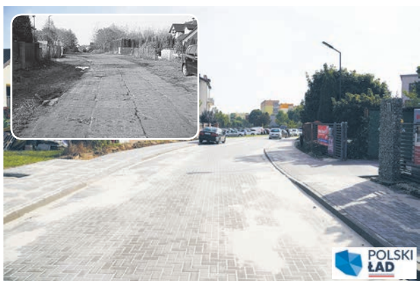
Ulica JAWOSZKA (za Biedronką) już przejezdna. Zyskała nową nawierzchnię z kostki betonowej oraz dwustronny chodnik.