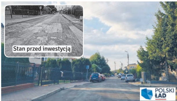
Ulica MILEJOWSKA w Łęcznej wyremontowana. Droga zyskała nową nawierzchnię asfaltową, co podniosło komfort użytkownika i poprawiło bezpieczeństwo uczestników ruchu drogowego.