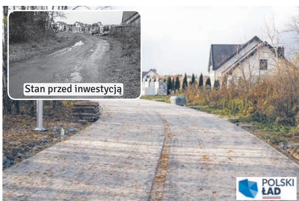
Zakończono modernizację ul. JAWOSZKA w Łęcznej. Droga zyskała nową nawierzchnię z kostki betonowej oraz oświetlenie uliczne.