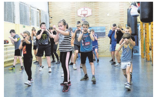
Bezplatne zajęcia dla dzieci